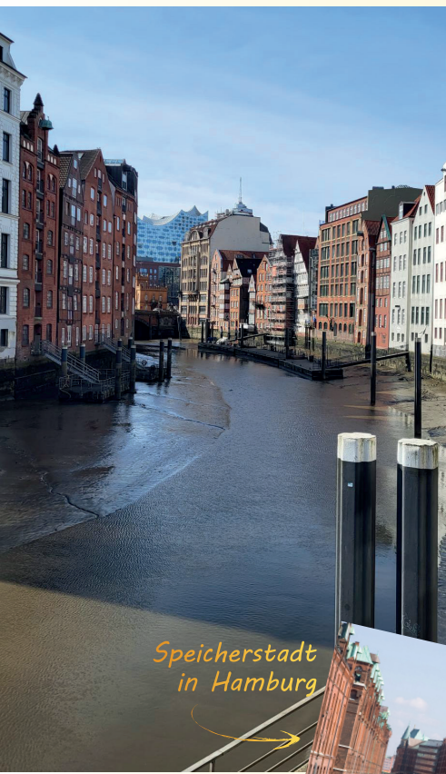
Speicherstadt in Hamburg