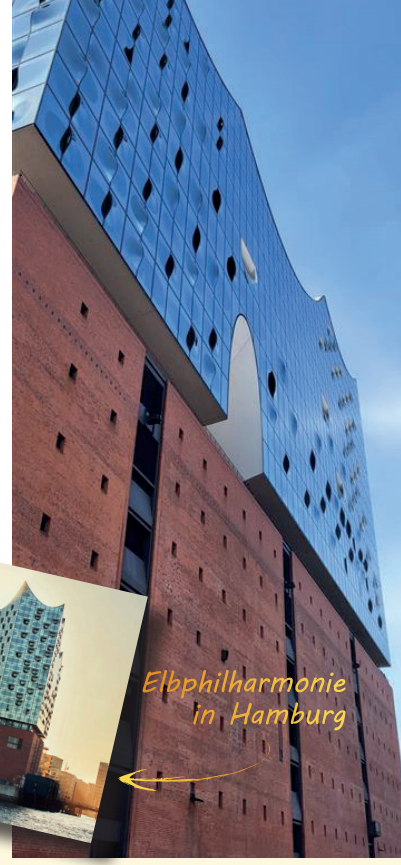
Elbphilharmonie in Hamburg