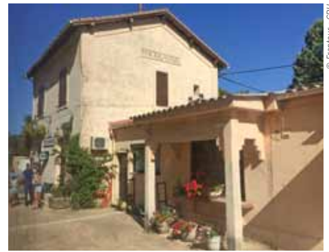
Bahnhof von Bocognano