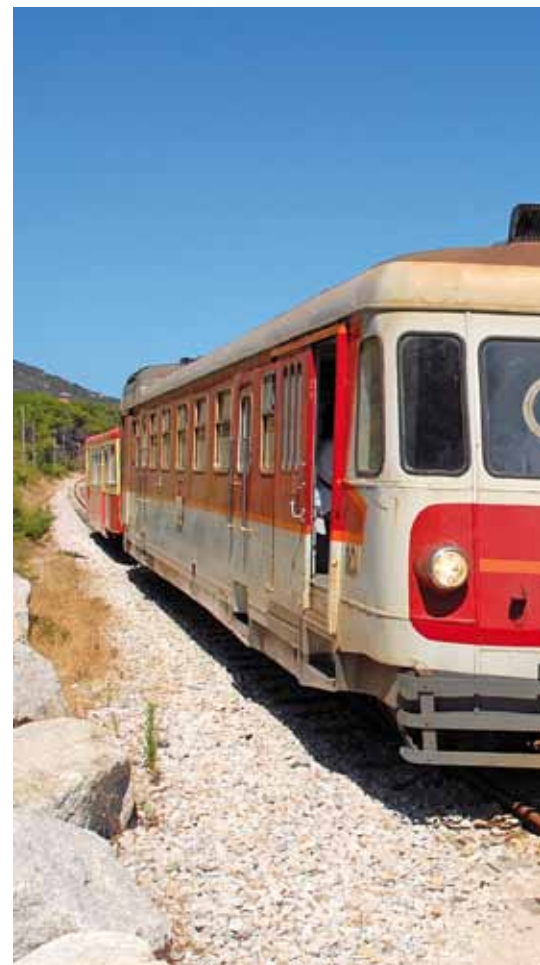
Strand von Calvi