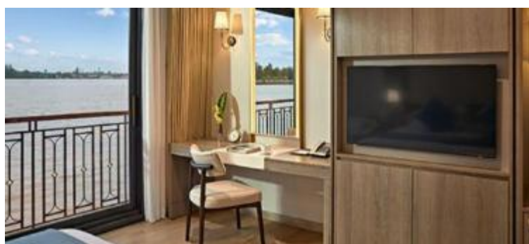
Economy / Classic-Kabine